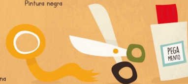
Cinta adhesiva, tijeras y pegamento