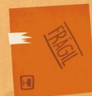
Lámina de cartón