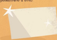
Lámina de plástico transparente o también puedes utilizar una lámina de vidrio. Esta lámina debe ser más grande que la caja más pequeña, y más pequeña que la caja grande.