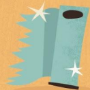
Papel de aluminio

Dos cajas de cartón de diferentes tamaños como para poner una dentro de la otra. Puedes dejar una diferencia de unos 4 a 5 centímetros de distancia con cada una de sus paredes. Las paredes de la entrada de ambas cajas pueden tocarse.