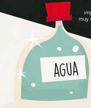
Botella de plástico