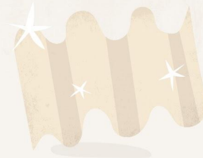
Trozo de plancha de zinc